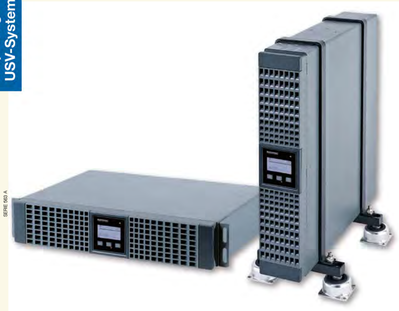
SERIE 603 A